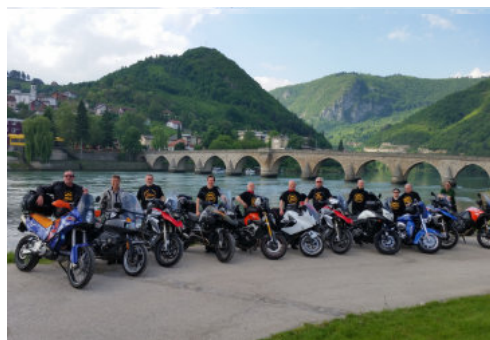
Tag 4: Dienstag Mokra Gora (SRB) – BiH – Zabljak (MNE) 215 km

Die Brücke von Visegrad, UNESCO Weltkulturerbe, ist der kulturelle Höhepunkt des Tages. Die Strecke dorthin entlang malerischer Schluchten ist eine mehr als würdige Vorbereitung bis wir schließlich die Grenze nach Serbien erreichen. Die kommunistische Vergangenheit ist an manchen Orten noch immer sicht- und spürbar. Der Mix mit der modernen Entwicklung macht den besonderen Flair Serbiens aus. Übernachtung in Mokra Gora (SRB).