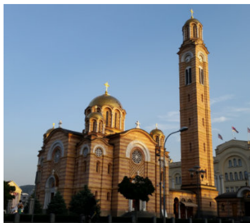
Tag 1: Samstag Graz (A) – Slowenien – Kroatien – Banja Luka (BiH) 380 km

Früh am Morgen treffen wir uns am vereinbarten Startpunkt bei Graz. Nachdem das gesamte Gepäck im Begleitfahrzeug verstaut ist, treten wir unsere gemeinsame Reise an. Vorwiegend auf der Autobahn geht es direkt nach Bosnien & Herzegowina in die Hauptstadt der Teilrepublik Srbska, nach Banja Luka. Unser Hotel liegt mitten im Zentrum. Nach der Ankunft machen wir noch einen gemütlichen Bummel durch die Altstadt. Übernachtung in Banja Luka (BiH).