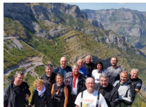
Tag 7: Freitag Shkodra (ALB) – Ohrid (MAK) 320 km

Wir erfreuen uns noch einmal der kurvigen Bergstraßen im Südosten Montenegros, bevor wir an die albanische Grenze kommen und das nächste Land der Tour besuchen. Der Zustand der Straßen, und ebenso die Freundlichkeit der Albaner, werden uns überraschen. Bei einem deutschsprachig geführten Stadtbummel und tauchen in die Stadt am Skutarisee ein. Übernachtung in Shkodra (ALB).